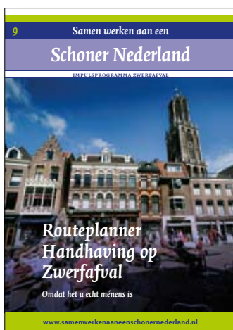
Routeplanner handhaving op zwerfafval