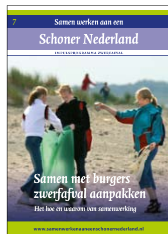
Samen met burgers zwerfafval aanpakken