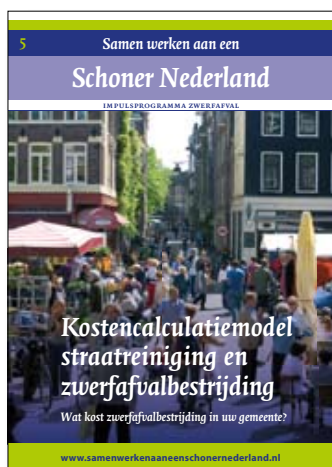
Kostencalculatiemodel straatreiniging en zwerfafvalbestrijding