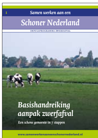
Basishandreiking aanpak zwerfafval