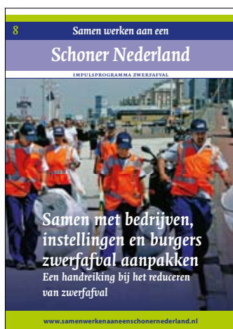
Samen met bedrijven, instellingen en burgers zwerfafval aanpakken