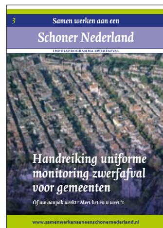
Handreiking uniforme monitoring zwerfafval voor gemeenten