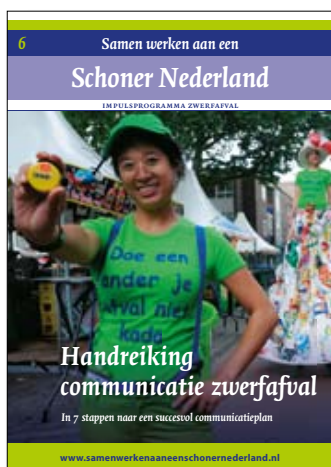
Handreiking communicatie zwerfafval