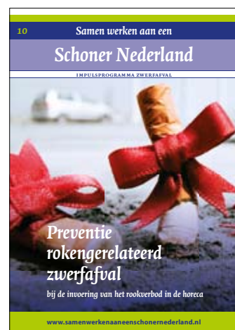
Preventie rokenrelateerd zwerfafval