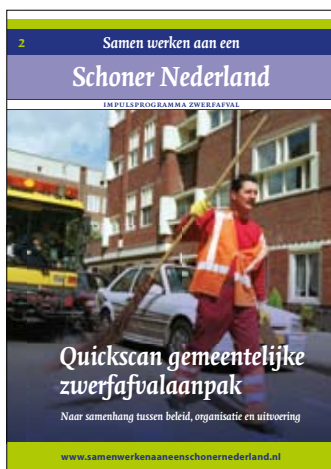
Quickscan gemeentelijke zwerfafvalaanpak